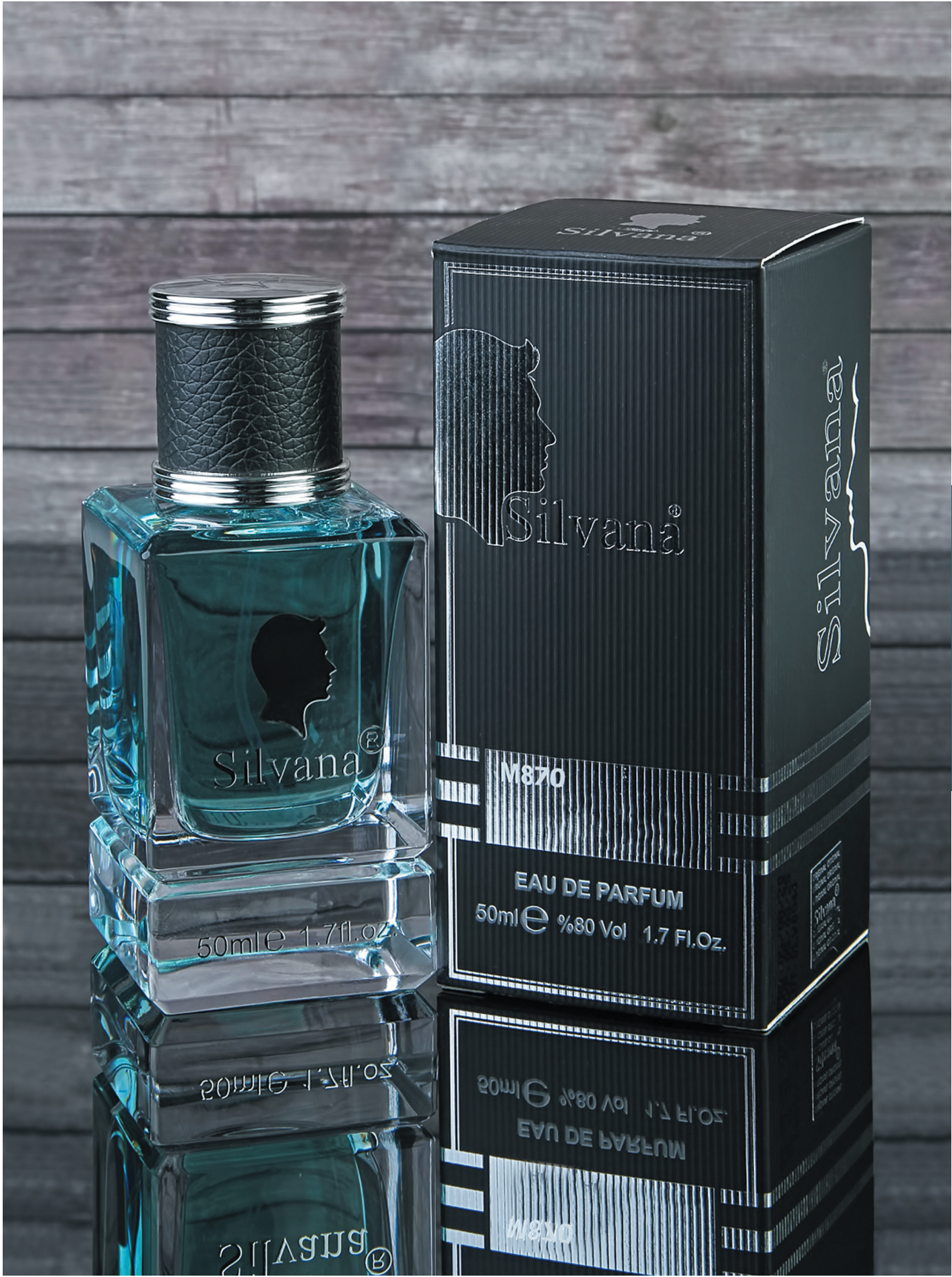
SILVANA 18ML, 50ML